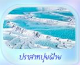
ปราสาทปุยฝ้าย