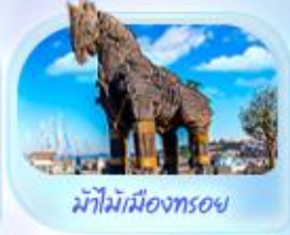
ม้าไม้เมืองทรอย