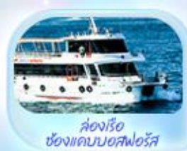
ล่องเรือ ช่องแคบบอสฟอรัส