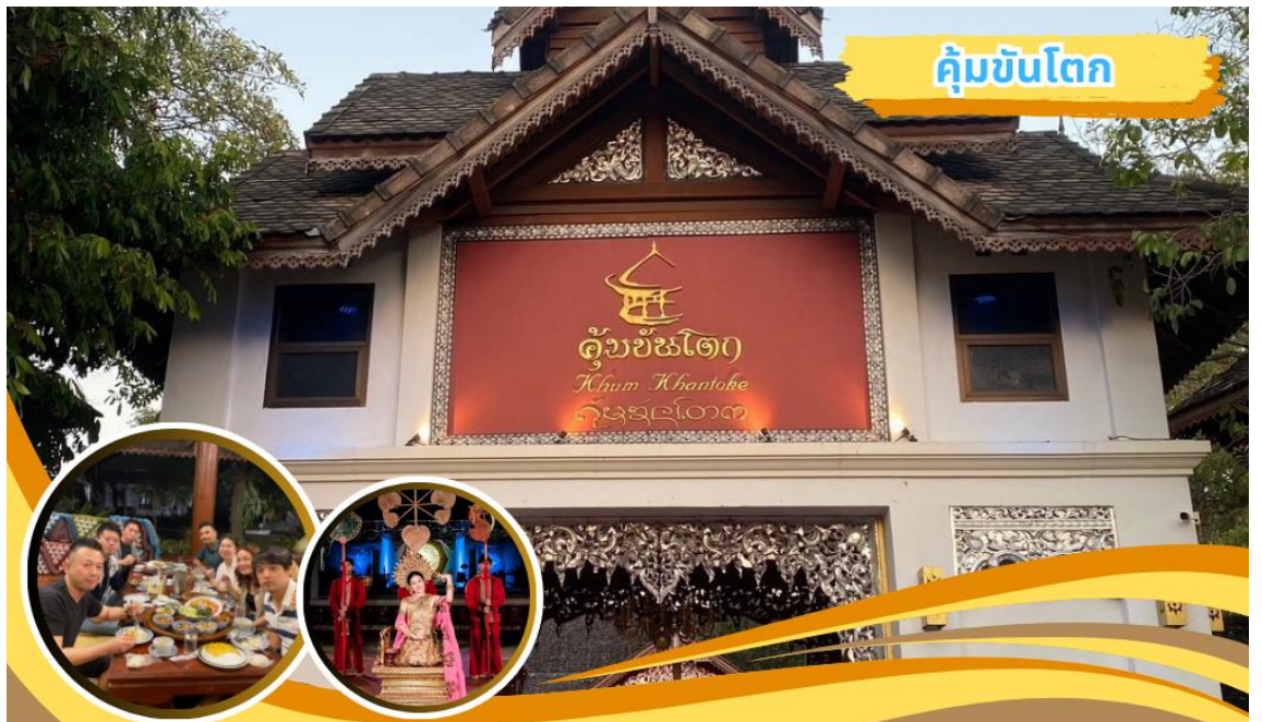
คุ่มขันโตก

นำคณะเดินทางไปรับประทานอาหารค่ำ ๑๐ อาหารค่ำ ณ คุ่มขันโตก(๖) พร้อมชมการแสดงพื้นเมืองลานนา หลังอาหารนำคณะเดินทางกลับที่พัก อิสระพักผ่อนตามอัธยาศัย