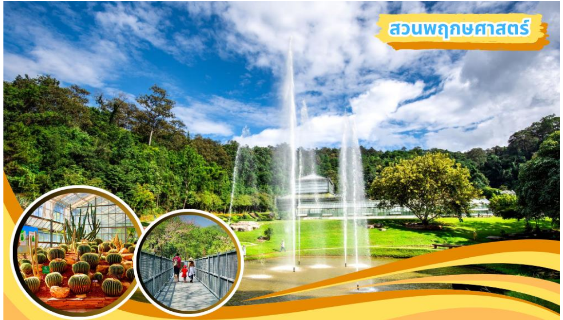
สวนพฤกษศาสตร์