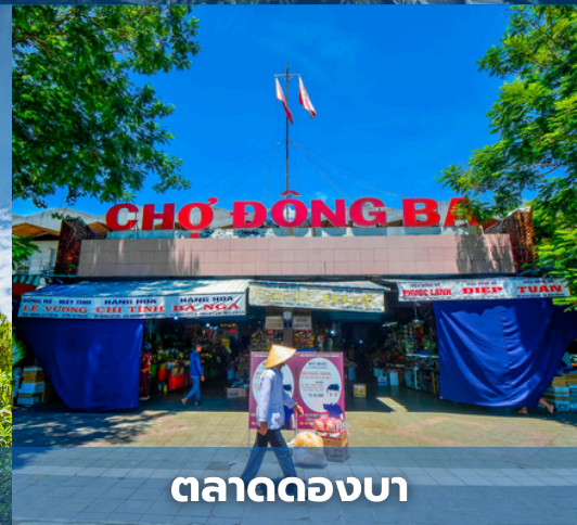
ตลาดดองบา

สำหรับเที่ยวบินที่แนะนำ : AIRASIA FD636 (DMK-DAD 10:30-12:10)