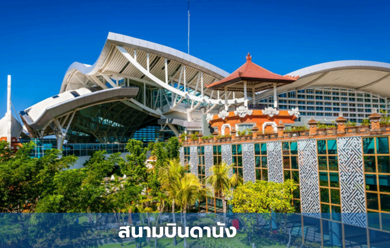
สนามบินดานัง