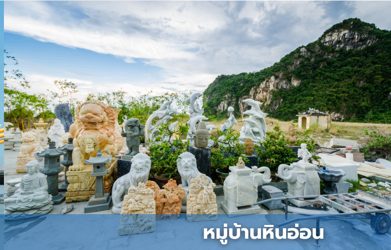
หมู่บ้านหินอ่อน