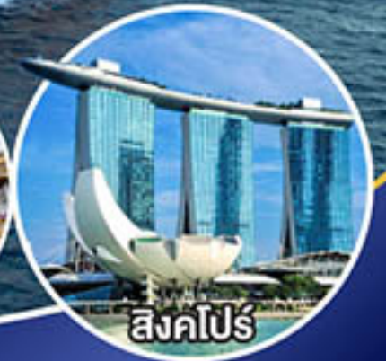
สิงคโปร์