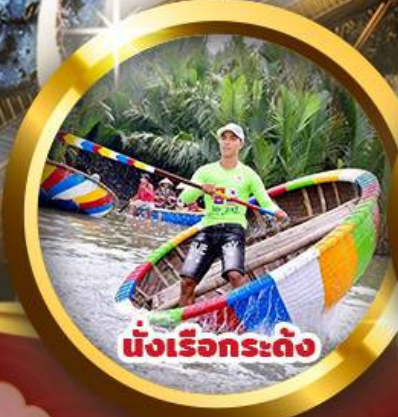
นั่งเรือกระดง