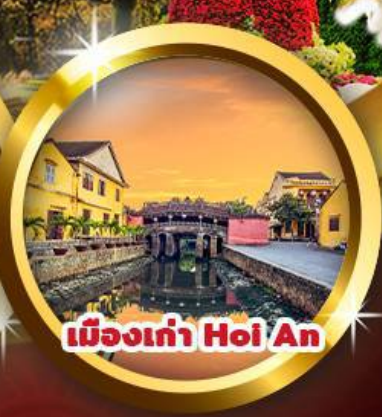
เมืองเก่า Hoi An

“นั่งกระเช้าที่ยาวที่สุดในโลก ล่องเรือกระดงชมวิถีหมู่บ้านกิมทาน สู่เมืองบานาฮิลล์ ชมวิวสะพานมือสีทอง เมืองมรดกโลกฮอยอัน”