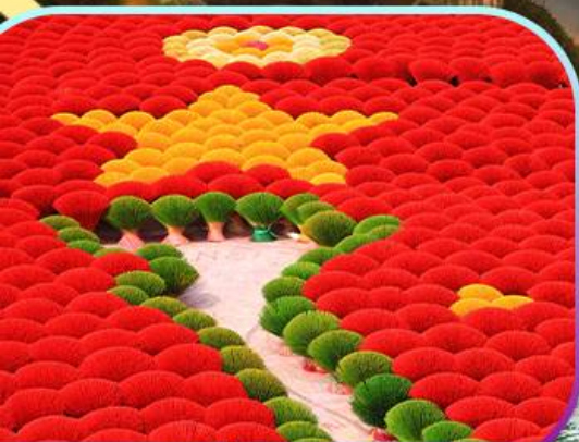
หมู่บ้านรูป