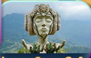
Moana Sapa Cafe