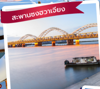
สะพานซวงฮวาเจียง