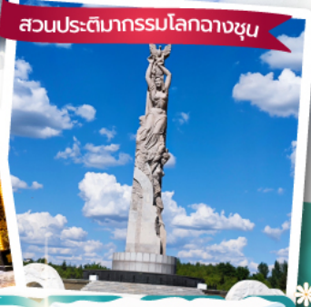
สวนประติมากรรมโลกวางซุน