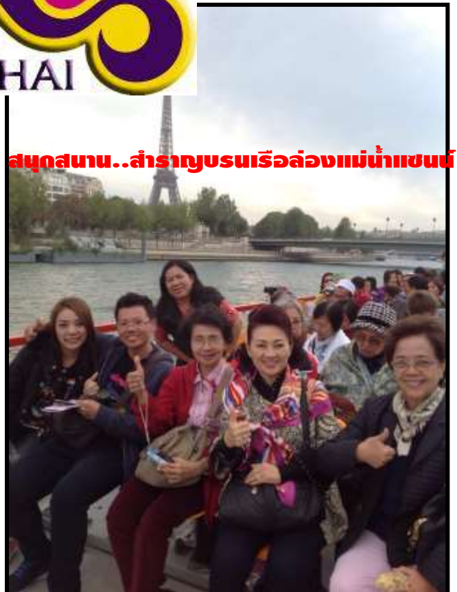
สนุกสนาน..สำราญชมเรือล่องแม่น้ำแซน

เรากำลังรอรับเกียรติจากทางท่าน...มาใช้บริการทัวร์ที่ดีจากทางเรา