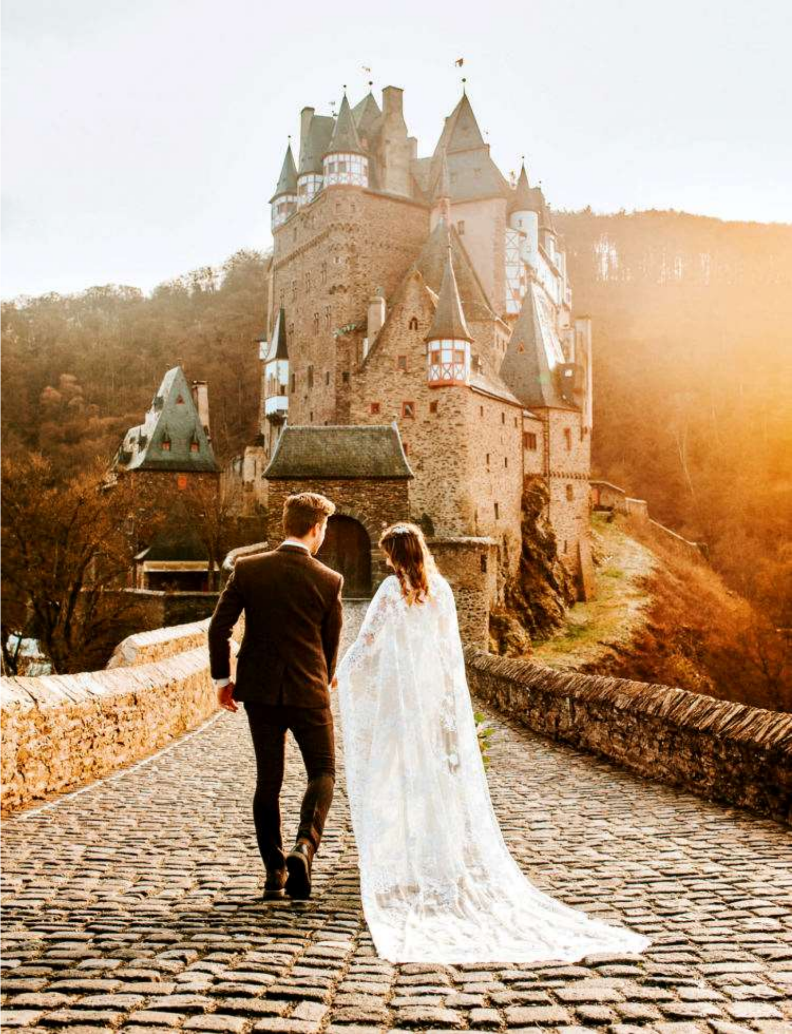
บันทึกภาพในปราสาทถ่ายภาพที่สวยงามคู่กับปราสาทเอลท์ Eltz castle UNSEEN