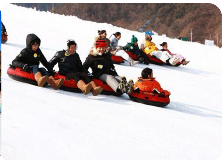
สาคู และชหอยูกบสภาพการณปัจจุบัน