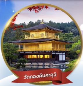
วัดทองคินคะคุจิ