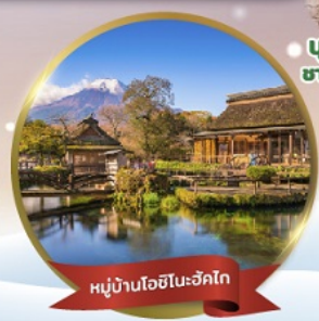
หมู่บ้านโอชิโนะฮักโก