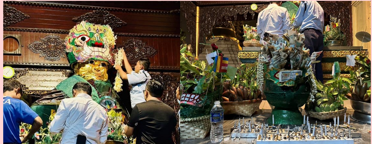
วิธีการขอพรจากแม่ยักษ์

พาท่านเดินไปขอพรที่ แม่ยักษ์ ผู้ปกป้องดูแลเจดีย์ คนพม่าเชื่อว่าแม่ยักษ์...จะช่วยในการตัดกรรมจากเจ้ากรรมนายเวร โดยเฉพาะอย่างยิ่งผู้ที่มีเวรกรรมกับเจ้ากรรมนายเวรทั้งหลายช่วยขจัดเคราะห์กรรม ขจัดอุปสรรค ติดขัดต่างๆ ความสำเร็จอธิษฐานขอให้ท่านช่วย ให้ชีวิตของคุณมีแต่ดีขึ้นเรื่อยๆ ซึ่งถ้าหากคุณกำลังมีทุกข์และหาหนทางไม่ออก ก็ลองมาไหว้ขอพรจะแม่ยักษ์ให้ช่วยบันดาลให้สิ่งร้ายๆ สิ่งไม่ดี ออกไปจากชีวิต และขอให้ชีวิตมีแต่สิ่งดีๆเข้ามา นอกจากนี้ยังเชื่อกันว่าแม่ยักษ์...ยังช่วยเรื่องความมีชื่อเสียงโด่งดัง เป็นที่รู้จักก้าวหน้าในหน้าที่การงาน ใครที่ตกงานอยู่ จุดนี้เป็นอีกหนึ่งจุดที่ต้องห้ามพลาด ปล.แม่ยักษ์จะประดิษฐานอยู่ติดกับบันไดประตูทางทิศตะวันออกค่ะ