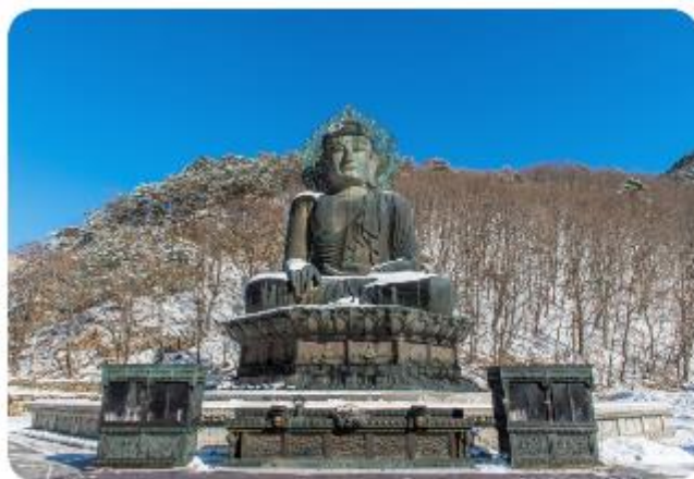
แห่งนี้ได้

อุทยานแห่งชาติแห่งเทือกเขาชอร์ค เป็นหนึ่งในสถานที่ท่องเที่ยวทางธรรมชาติที่มีชื่อเสียงที่สุดของเกาหลีใต้ เทือกเขาที่ทอดตัวยาวไปตามเมืองต่าง ๆ ครอบคลุมอาณาบริเวณของเมืองชกโซ โกซอง อินเจ และยัง ยาง ในจังหวัดคังวอน ได้รับการกำหนดให้เป็นอุทยานแห่งชาติแห่งที่ห้าของเกาหลีใต้เมื่อปี ค.ศ. 1970 และยังเป็นเขตสงวนชีวมณฑลของโลก โดยองค์การยูเนสโกเมื่อปี ค.ศ. 1982 อุทยานแห่งนี้มีพื้นที่รวม 398 ตารางกิโลเมตร เนื่องจากยอดเขาของเทือกเขาแห่งนี้ถูกปกคลุมไปด้วยหิมะเป็นเวลา 5 – 6 เดือนของปี ที่นี้จึงถูกเรียกว่า “ชอร์ค” ซึ่งหมายถึงยอดเขาที่เต็มไปด้วยหิมะ และยังมียอดเขาอื่น ๆ อีก 30 ยอด เช่น โซซงบง ฮวาแซบง และจุงซงบง ที่เต็มไปด้วยทิวทัศน์อันงดงาม รวมถึงน้ำตกและถ้ำอีกหลายแห่งที่อยู่ในอุทยานแห่งนี้ ที่อุทยานยังมีการบริการขึ้นสู่ยอดเขาด้วยกระเช้าไฟฟ้า ทั้งนี้เพื่ออำนวยความสะดวกสำหรับผู้พิการและผู้สูงอายุ เพื่อให้ทุกคนสามารถขึ้นไปบนยอดเขา ทศนาอย่างเพลิดเพลินกับทัศนียภาพอันงดงามของ “ชอร์คซาน”