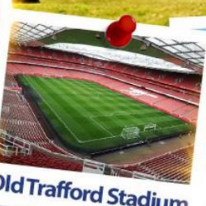
Old Trafford Stadium