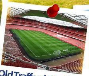
Old Trafford Stadium