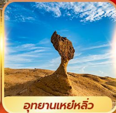
อุทยานเหยหลิว