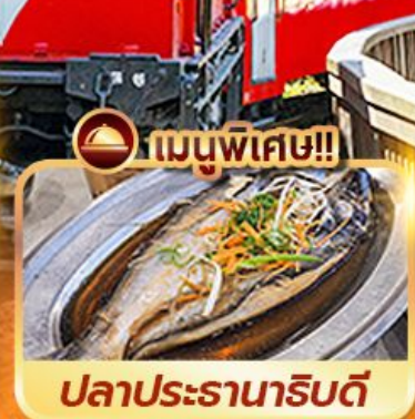
ปลาประดานาธิบดี