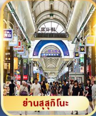
ย่านすすกิโนะ