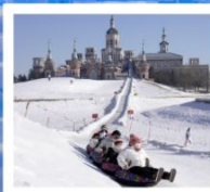
ฤดูหาลานวอลการ