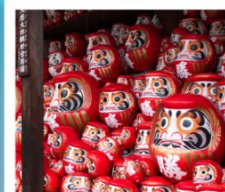
วัดคิตสึอิชิ