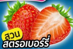
สวน สตราวเบอร์รี่