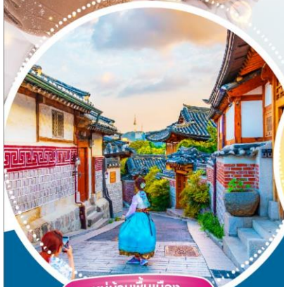
หมู่บ้านพื้นเมือง พูซอนอันนุก