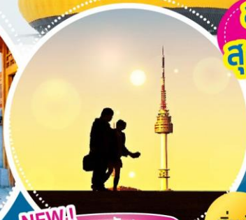
NEW! มุมลับ! หอค้อย N โซล