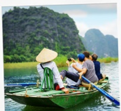
ล่องเรือ Tamcoc