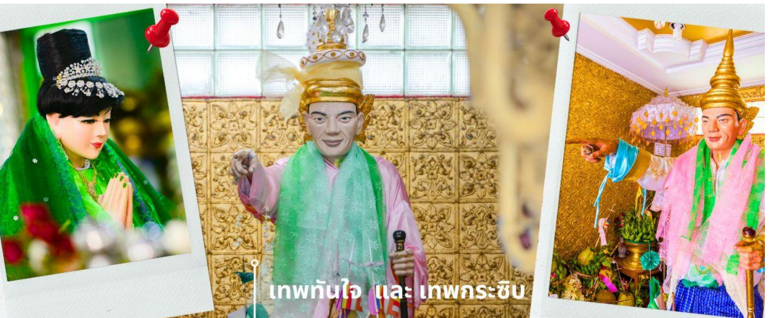
เทพทันใจ และ เทพกระซิบ

เจดีย์โบตาทาว (Botahtaung Pagoda) หมายถึง ทหาร 1,000 นาย เมื่อในอดีตพระเจ้าโองะลาปะกษัตริย์มอญ ได้ให้ทหาร 1,000 นาย ตั้งแถวถวายความเคารพพระเกศาธาตุ บรรจุไว้ 1 เส้น ในเจดีย์นี้ ที่อันเชิญมาจากอินเดีย ไฮไลท์ที่สำคัญที่นักท่องเที่ยวนิยมมาสถานที่แห่งนี้คือ การมาสักการะบูชา เทพทันใจ หรือ นัตโบโบยี และยังมี เทพกระซิบ ภายในเจดีย์เป็นที่เก็บผอบหินทรงสลับพบสมบัติล้ำค่าหลายชนิดเช่น อัญมณี, เครื่องประดับ, เพชรพลอย, จาริกดินเผา, และพระพุทธรูปทองคำ, เงิน, ทองเหลือง, หิน พระพุทธรูปจำนวนทั้งหมดภายในและภายนอกผอบราวกว่า 700 องค์ จาริกดินเผาบางส่วนเป็นเรื่องราวของคำสอนและเรื่องราวทางพุทธศาสนาของนัตโบโบยี หรือ คนไทยรู้จักกันในชื่อว่า เทพทันใจ เป็นคำเรียกเทพเจ้านัต ที่เป็นเทพารักษ์ประจำวัดหรือพระเจดีย์ในศาสนาพุทธแบบพม่า โดยทั่วไปนิยมสร้างรูปเคารพโบโบยี เป็นรูปเคารพชายสูงวัยขนาดเท่าบุคคล สวมเครื่องประดับศิระ บางครั้งถือไม้เท้าเพื่อเข้าถึงความอาวุโส เทพทันใจแห่งนี้ เป็นสถานที่ที่คนไทยให้ความนับถือเป็นอย่างมาก เชื่อกันว่าการได้มาขอพรกับ นัตโบโบยี จะสัมฤทธิ์ผลทุกประการ จนเป็นที่กล่าวถึงและเล่าขานสืบกันมาช้านาน โดยใกล้กันยังมี เทพกระซิบ ซึ่งมีนามว่า “อะมาดอว์เม็ยะ” ตามตำนานกล่าวว่า นางเป็นธิดาของพญานาค ที่เกิดศรัทธาในพุทธศาสนาอย่างแรงกล้า รักษาศีล ไม่ยอมกินเนื้อสัตว์จนเมื่อสิ้นชีวิตไปกลายเป็นนัต