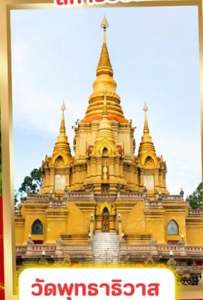
วัดพุทธาริวาส