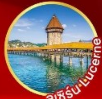
ลูเซิร์น-Lucerne