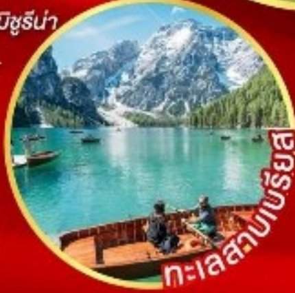
ทะเลสาบเบรียส