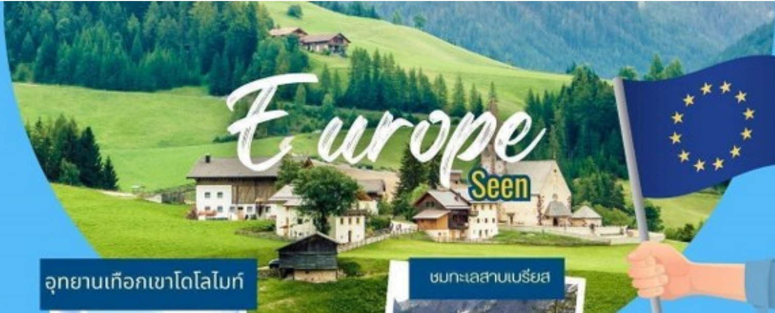
อุทยานเทือกเขาโดโลไมท์