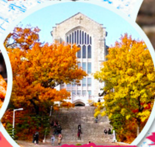
มหาวิทยาลัยอีฮวา