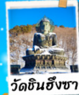
วัดชินฮังซา