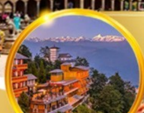
พักโรงแรมบนเขา ชมวิวหิมาลัยสุดฟิน