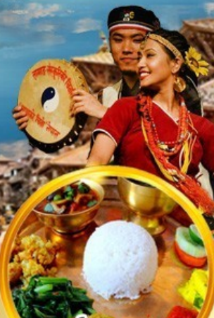
ไขว่สุดพิเศษ ลิ้มรสอาหารเนปาลีแท้

กาฐมัณฑุ โทดรา ภัคตาบูร์ ปาทัน นากากีออต