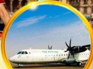
บินภายใน 1 ขา