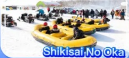
Shikisai No Oka