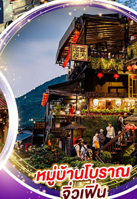
หมู่บ้านโบราณ จิวเพิน

นั่งรถไฟชมอุทยานอาลีซาน ล่องเรือชมทะเลสาบสุริยันจันทรา วัดเหวินหัว วัดพระถังซำจั๋ง เค้าดาวนับบริเวณตึกไทเป101 อนุสรณ์สถานเจียงไคเช็ค