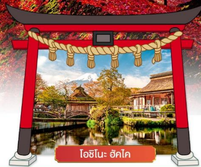
โอชิโนะ ฮักโค

เดินทางโดยสายการบิน : ไทยแอร์เอเชียเอ็กซ์