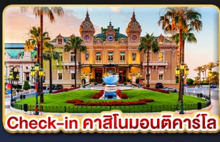
Check-in คาสิโนมอนติคาร์โล