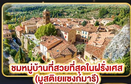
ชมหมู่บ้านที่สวยงามที่สุดในฝรั่งเศส (บูสตีเยแซงท์มารี)