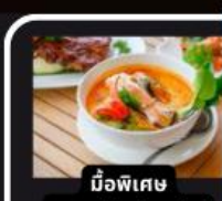
มือพิเศษ อาหารไทยในยุโรป