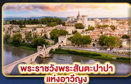
พระราชวังพระสันตะปาปา แห่งอเวียง