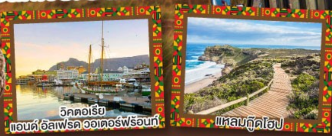
วิกตอเรีย แอนดริวเฟรดวอเตอร์พร้อนท์

เปิดประสบการณ์กับภัตตาคาร Carnivore สวรรค์ของคนรักเนื้อสัตว์