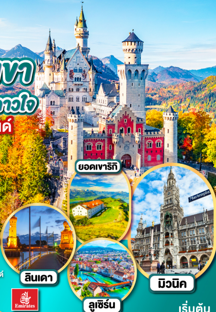
ยอดเขารีกี