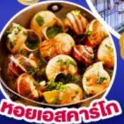
หอยเอสคาร์โก