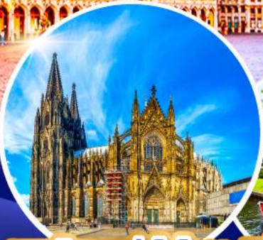
มหาวิหารแห่งโคโลญ หมู่บ้านทิวร์น