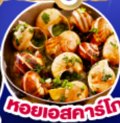
หอยเอสคาร์โก

เดินทาง 11-19 ต.ค.67/ 14-22 พ.ย.67 25 ธ.ค.67 - 2 ม.ค.68(เทศกาลปีใหม่)