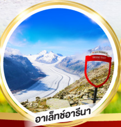
อาเล็กซ์อาร์นา