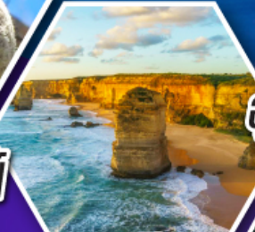
อุทยานบลูเมาส์แท่น