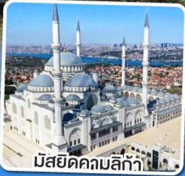
มัสยิดคคมลิก้า