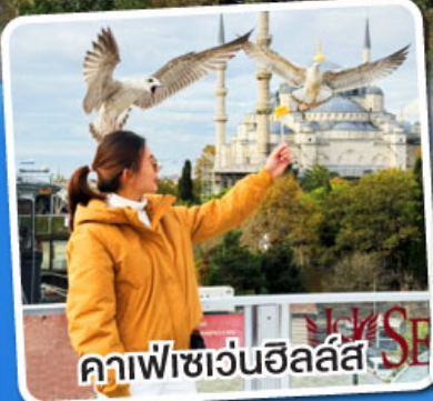
คาเฟ่เซเวนฮิลล์ส

ฟรี!! พวงกุญแจ Evil Eye ชาแอปเปิ้ล, โยเกิร์ตมาโก