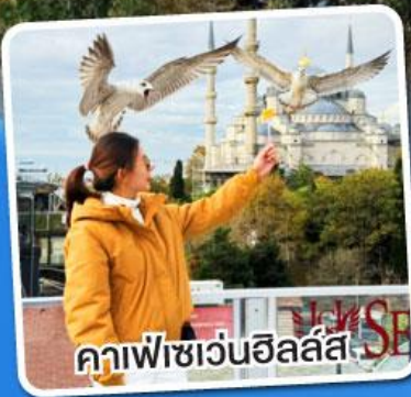
คาเฟ่เซเวนฮิลล์ส์

ฟรี!! พวงกุญแจ Evil Eye ชาแอปเปิ้ล, ไอศกรีมมาโก