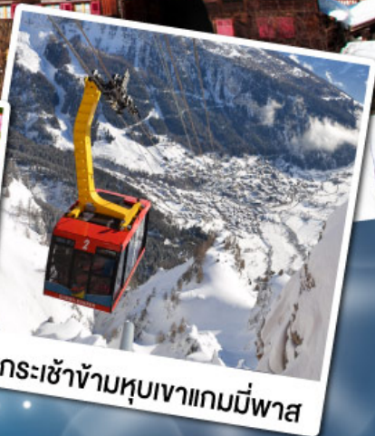
กระเช้าข้ามหุบเขาเกมมีพาส

18-24 ก.พ. 68 11-17 มี.ค. 68 29 เม.ย.-05 พ.ค. 68