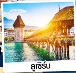
ลูซิิร์น

พิเศษ!! อาบนํ้าแร่แช่นํ้าอุ่น ณ เมืองลูคอร์เนค เมืองแห่งนํ้าแร่สวิตเซอร์แลนด์