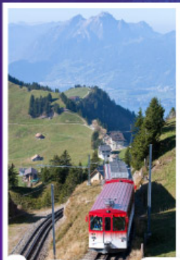
นั่งรถไฟใต้เขาริกิ