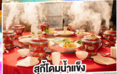
สุกี้ไต้มน้ำแข็ง