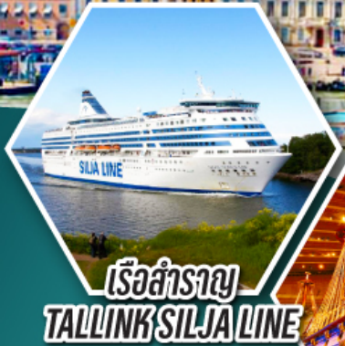
เรือสำราญ TALLINK SILJA LINE