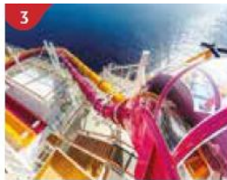
3 Waterslide Park Get drenched in fun on one of our six different waterslides.