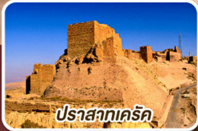
ปราสาทเคิร์ค