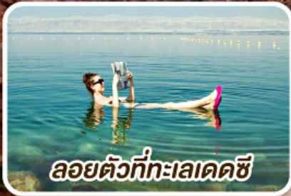
ล่องตัวที่ทะเลเดดซี