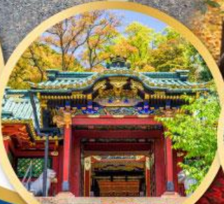
ศาลเจ้าโทโชคุ