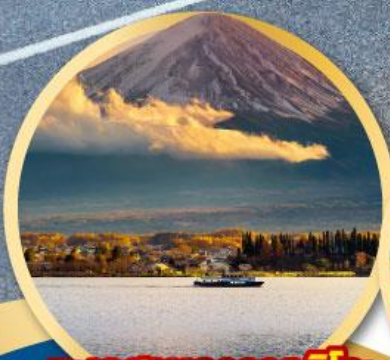
ทะเลสาบคาวากุจิโกะ