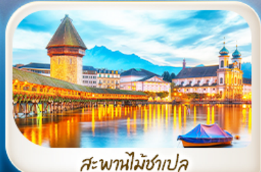
สะพานไม้ชาเปิล