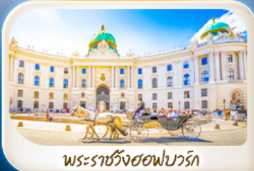
พระราชวังฮอฟบวร์ก

12-18 มี.ค.68 / 19-25 มี.ค.68 28 เม.ย. - 4 พ.ค.68 7-13 พ.ค.68