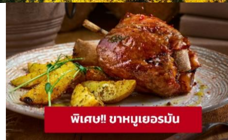
พิเศษ!! ขาหมูเยอรมัน

ที่พัก : DORMERO Hotel Zürich Airport หรือโรงแรมและเมืองระดับใกล้เคียงกัน (ชื่อโรงแรมที่ท่านพัก ทางบริษัทจะทำการแจ้งพร้อมใบนัดหมาย 5-7 วัน ก่อนวันเดินทาง)