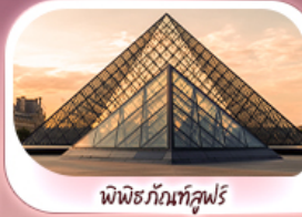
พีพิดกับที่ลูฟวร์