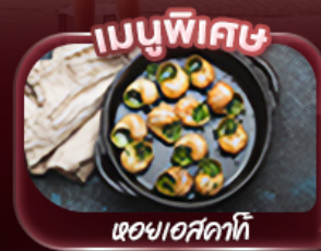
หอยแอสคาทิ

“สัมผัสประสบการณ์สุดพิเศษกับแลนด์มาร์คชื่อดังเมืองปารีส” ชมหอไอเฟล ล่องเรือชมวิวปารีสสองฝั่งแม่น้ำแซน ประดูชย์อันยิ่งใหญ่ เยือนพระราชวังแวร์ซายส์ อลังการด้วยสถาปัตยกรรมและสวนอันกว้างใหญ่ พิพิธภัณฑ์ลูฟร์ ซอปปิงที่ถนนชองเซลีเซ อิสระเต็มวันสัมผัสบรรยากาศปารีส