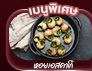
เมนูพิเศษ

ชมหอไอเฟล ล่องเรือชมวิวปารีสสองฝั่งแม่น้ำแซน ประดูชัยอันยิ่งใหญ่ เยือนพระราชวังแวร์ซายส์ อลังการด้วยสถาปัตยกรรมและสวนอันกว้างใหญ่ พิพิธภัณฑ์ลูฟร์ ช้อปปีงที่ถนนชองเซลีเซ อีสรະเต็มวันสัมผัสบรรยากาศปารีส