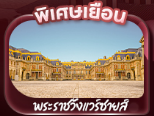
พระราชวังแวร์ซายส์