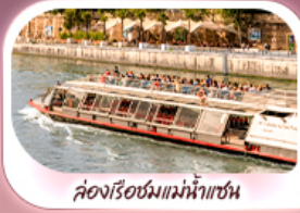
ล่องเรือชมแม่น้ำแซน