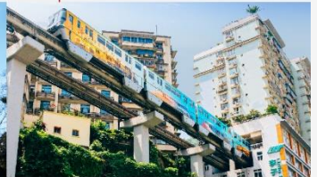
รถไฟฟ้าทะเลตึก

*ทางบริษัทฯ ขอสงวนสิทธิ์ในการสลับโปรแกรมทัวร์ตามความเหมาะสมขึ้นอยู่กับสถานการณ์หน้างาน โดยคำนึงถึงผลประโยชน์ของลูกค้าเป็นสำคัญ