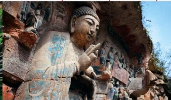
ผาหินแกะสลักต้าจู้ เขาเป่าติงซาน