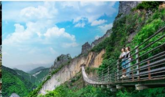
หุบเขารอยแยกอุ๋หลิงซาน