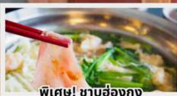
พิเศษ! ชาบูฮ่องกง

พักรูในดิสนีย์แลนด์ 1 คืน พร้อมบัตรเครื่องเล่นแบบจุใจ