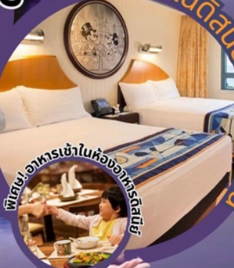
พิเศษ! อาหารเข้าในห้องอาหารพิเศษ