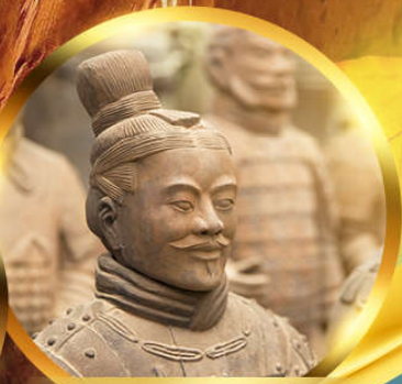
สุสานทหารจิ๋นซี